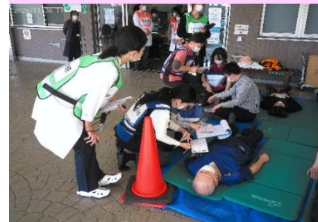
トリアージを実施