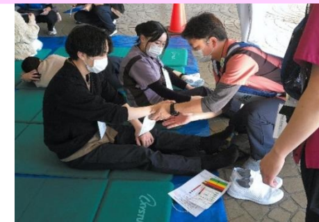
トリアージタグを患者に装着