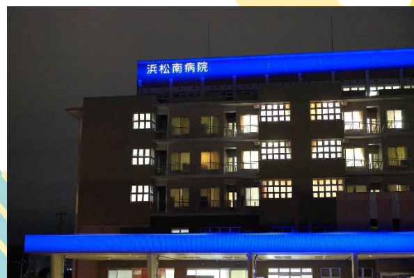
糖尿病予防のシンボルマーク「ブルーサークル」にちなみ、病院をブルーでライトアップ