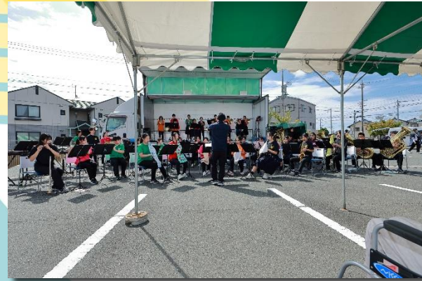
浜松南部中学校吹奏楽部の演奏

2025年10月5日に浜松健幸マルシェを開催しました。近隣の皆様のご参加ありがとうございました。おかげさまで多くの方にご来場いただくことができました。来年も是非お越しください。