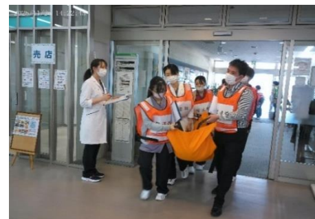
布担架で患者を移動