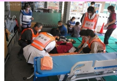
搬送のためストレッチャーに移動