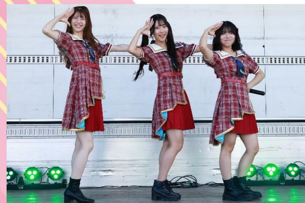
ご当地アイドルユニット「H&A.」のライブ